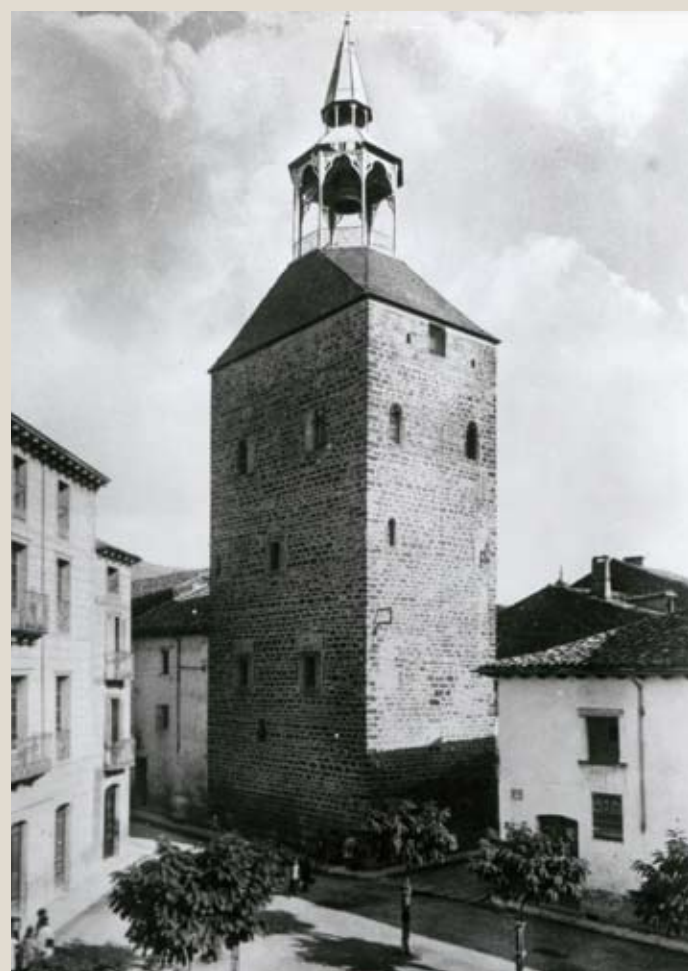
▼ La Torre del Reloj a principios del siglo XX.