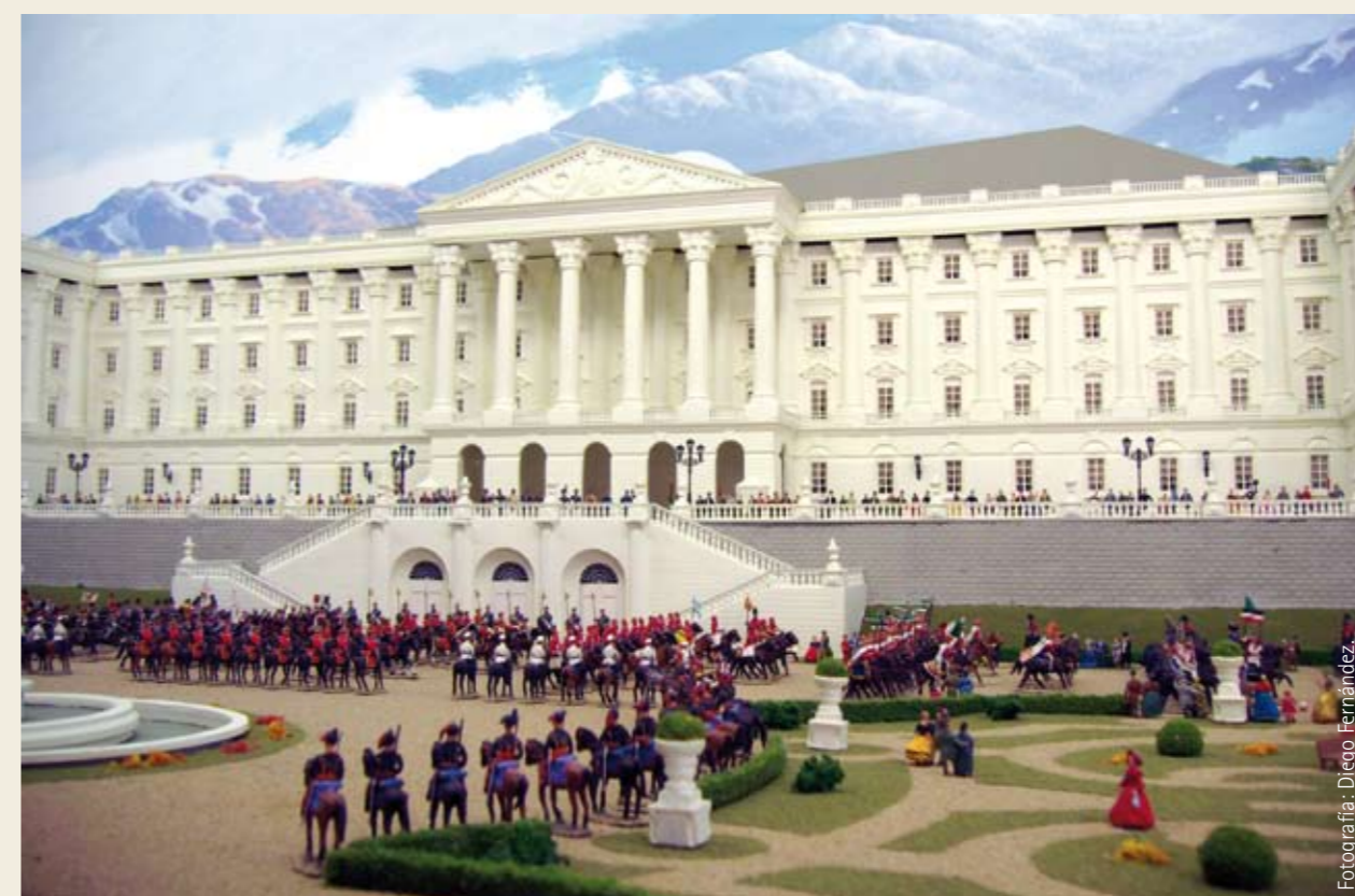
▲ Cada diorama representa un momento de la Historia recreado como si de una fotografía tridimensional se tratara. En cada uno de ellos miles de soldaditos se sitúan de forma estratégica y entre ellos siempre se esconden sorpresas y personajes a los que hay que descubrir.

À l'intérieur du château, un espace est réservé au musée, très singulier et unique en son genre. Un musée pour tous les âges qui vient s'ajouter, depuis 2007, à l'offre culturelle et de loisirs de la ville. Une collection de plus de 32 000 figurines de soldats de plomb constitue son principal attrait, en nous racontant l'évolution des armes, des uniformes, des tactiques de combat, ainsi que l'histoire des conflits armés de l'époque des Pharaons jusqu'à nos jours, et surtout, le chemin menant à la paix.