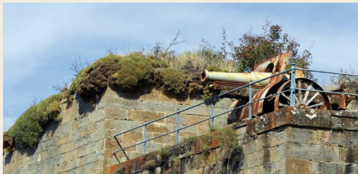
▲ En 1890 llegaron desde la fundición ovetense de Trubia once cañones. Para superar la difícil orografía del lugar y facilitar el transporte de los materiales de construcción y de la pesada artillería se contrató a la empresa jacetana de sogas "Viuda e hijos de Piedrafita Nogués" que fabricó en Huesca un cable de cáñamo de 37 metros y 200 kilos.

Su construcción, que se había iniciado a la vez que la del fuerte de Coll de Ladrones en Canfranc y Santa Elena en Biescas, en un intento de la monarquía española por fortificar la frontera pirenaica, finalizó en noviembre de 1900. En ella trabajaron 250 jornaleros de la zona además de numerosos canteros y su coste supuso para el estado seis millones de pesetas.